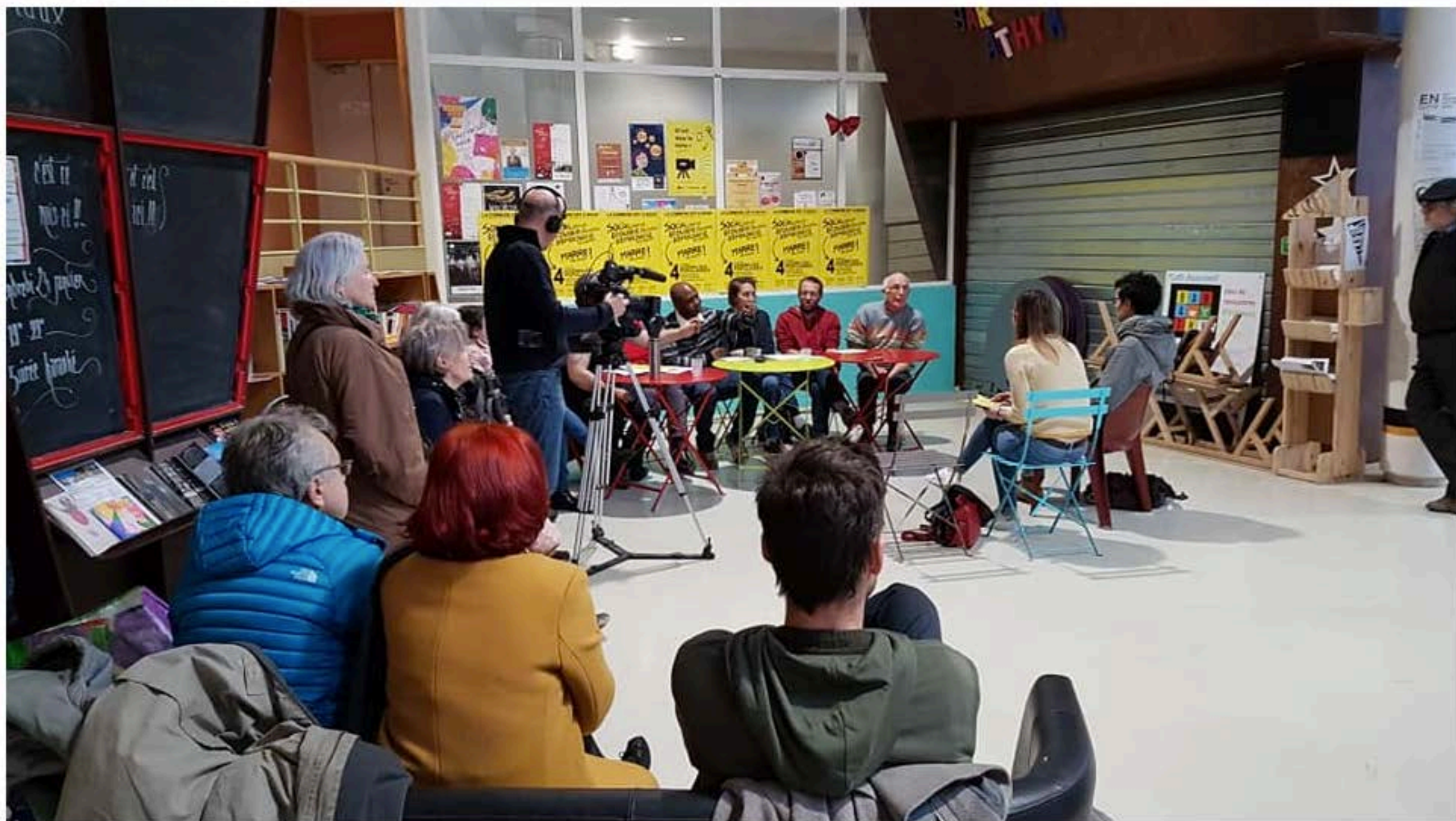
Première conférence de presse de La commune est à nous ! au Patio, samedi 18 janvier 2020. Image 1 of 4